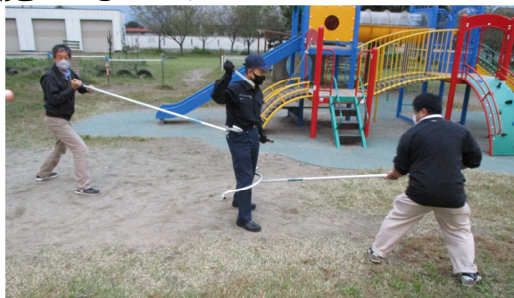
【職員は不審者に対峙】

外遊びの時に不審者が侵入してきた想定で、児童は部屋に避難したり、職員は「さすまた」を使って不審者に対峙したりしました。